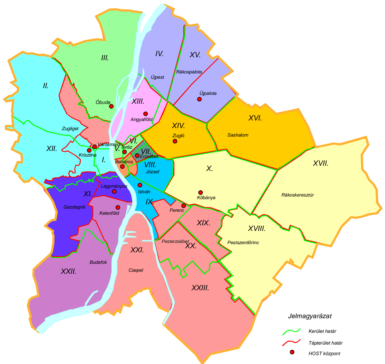
1.2. ábra. A budapesti Helyi Zónák földrajzi elhelyezkedése